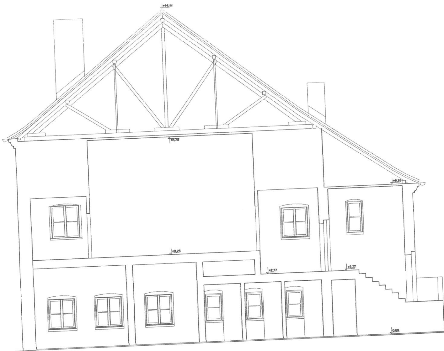
Przekrój B - B skala 1:100