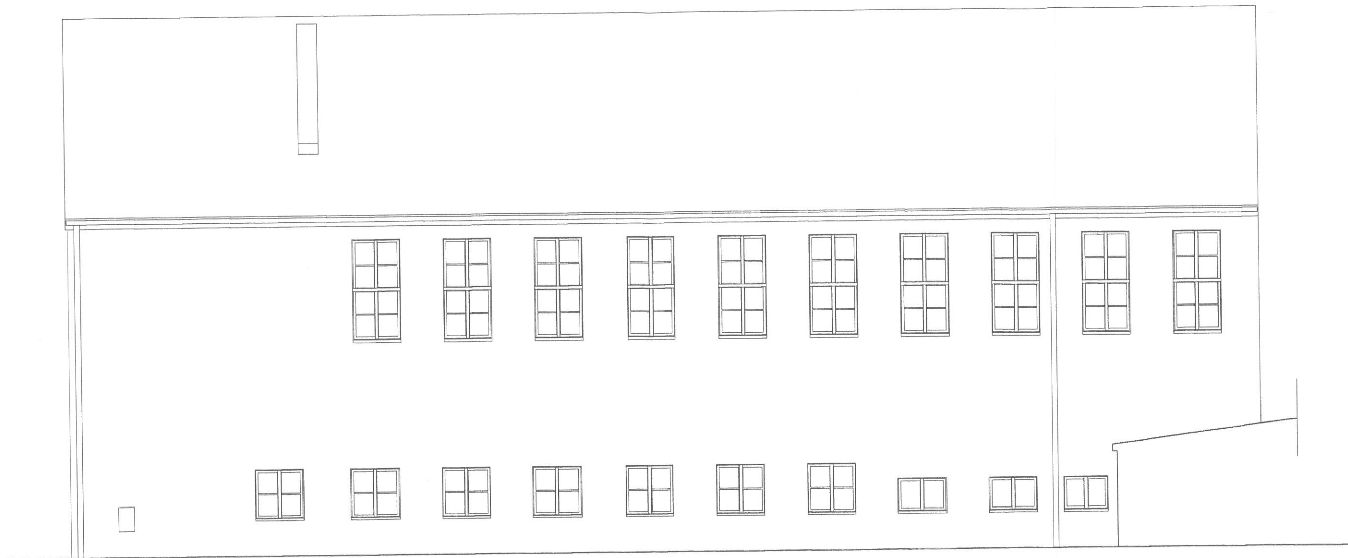
Elewacja tylna (południowa) skala 1:100