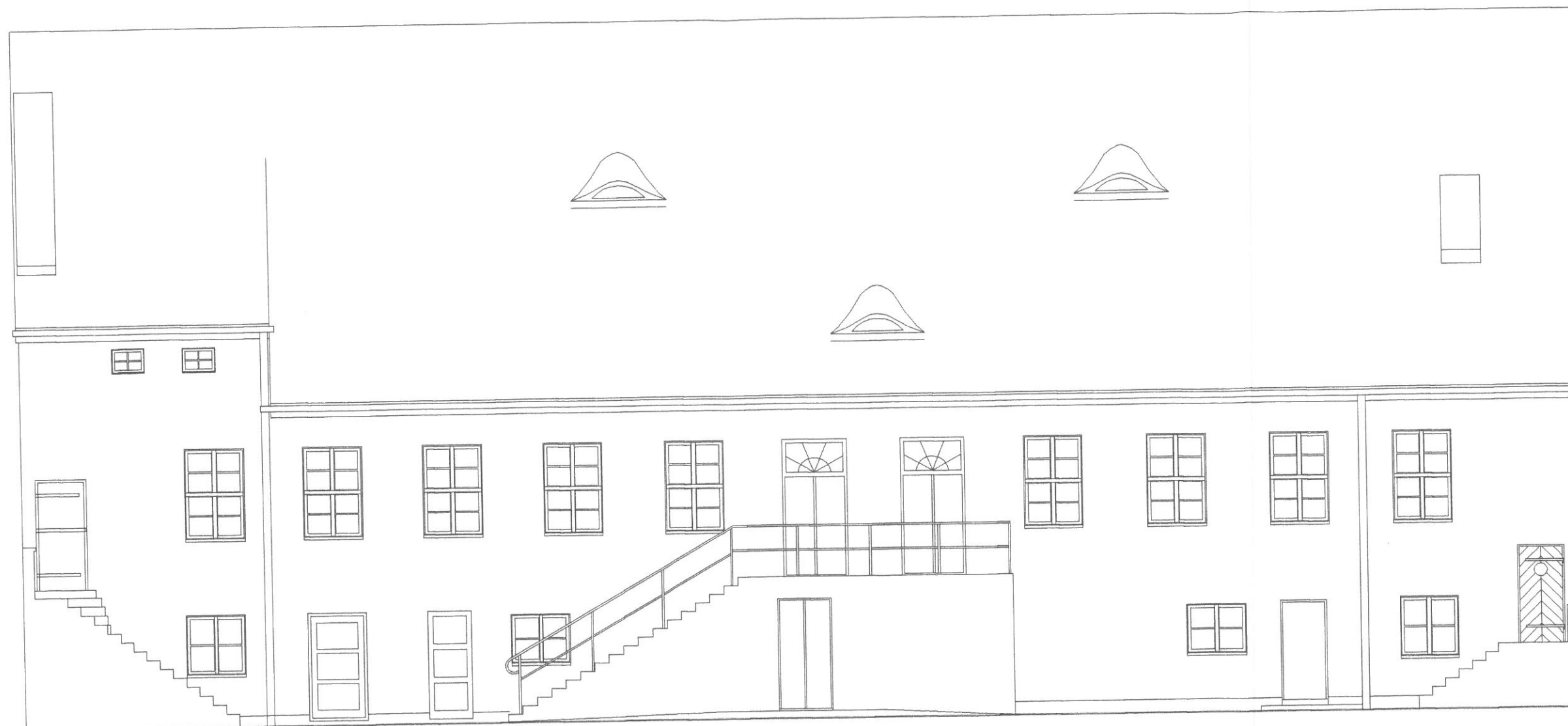
Elewacja frontowa (północna) skala 1:100