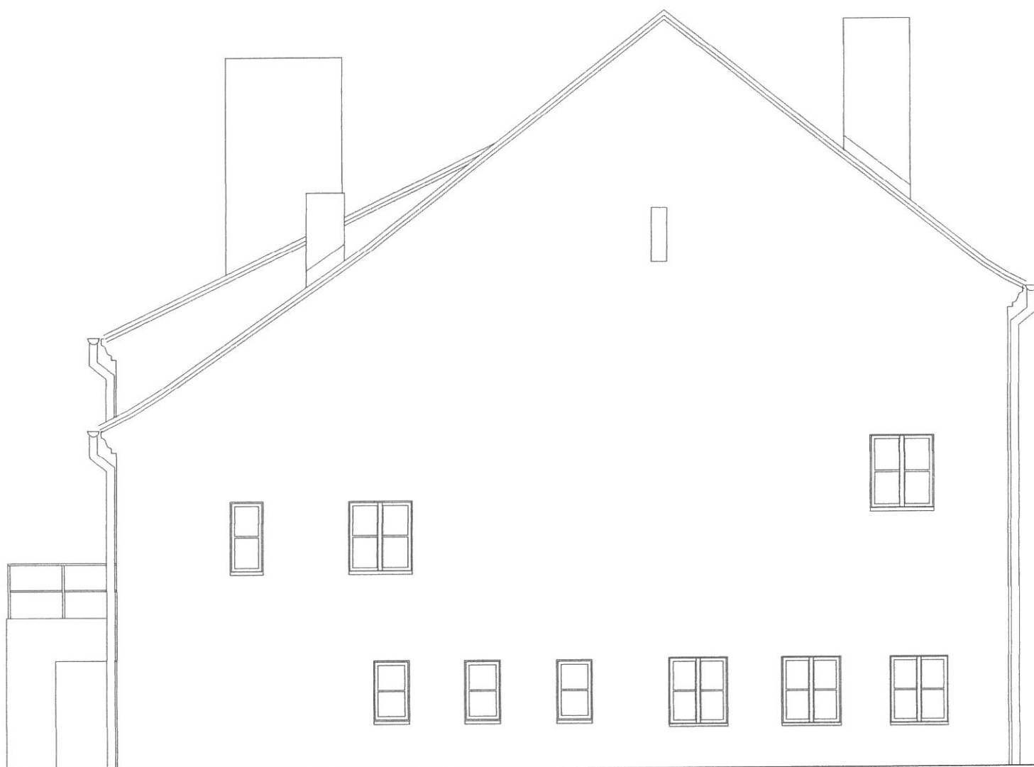
Elewacja boczna (zachodnia) skala 1:100