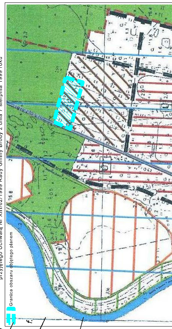
Fragment Studium uwarunkowań i kierunków zagospodarowania przestrzennego Gminy Brody przyjętego Uchwałą Nr XIII/62/1999 Rady Gminy Brody z dnia 7 sierpnia 1999 roku